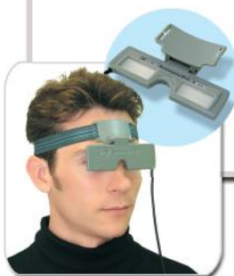
Googles per VEP