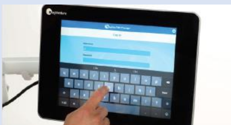
Un monitor touchscreen montato sul carrello dello stimolatore