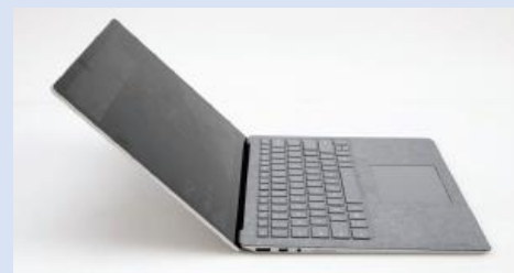
Un pc laptop (non incluso) predisposto per la connessione a internet

Il sistema di gestione dei pazienti può anche essere acquistato come soluzione software stand-alone, anch'essa basata su cloud ma dipendente dall'inserimento manuale dei dati.