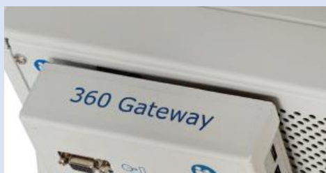
Un modulo Gateway 360 collegato al pannello posteriore dello stimolatore

Tutto ciò di cui hai bisogno comprende questi componenti: